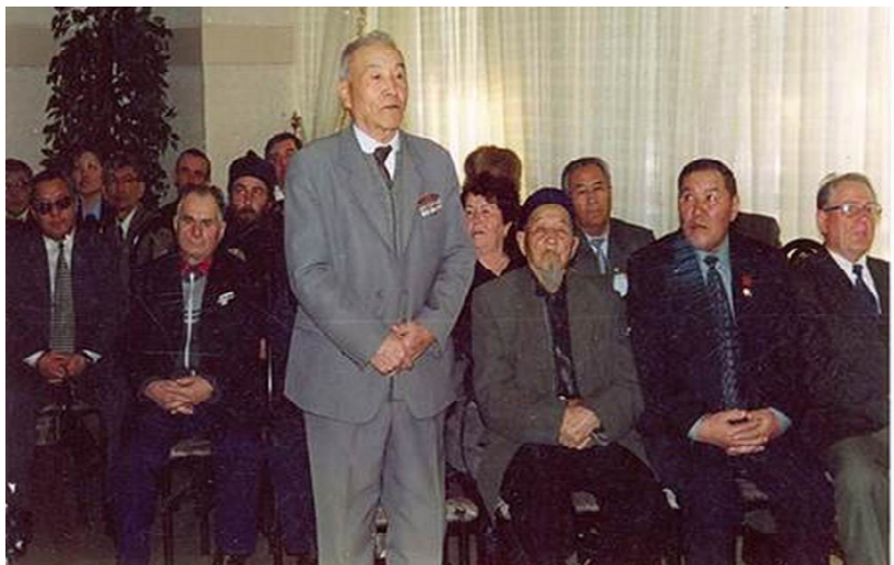
1998 жыл. Сәтбаев қалалық Ардагерлер Кеңесінің төрағасы болып сайланған сәт