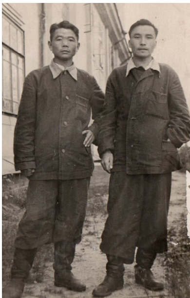
Соғыстан соң. Алматы. Әскери госпитальда