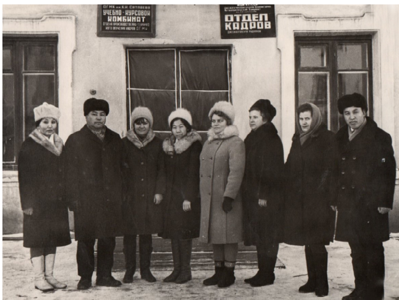
Ш.Байбосынұлы көптеген жылдар Жезқазған тау-кен комбинатының кадр бөлімінде абыройлы еңбек етті