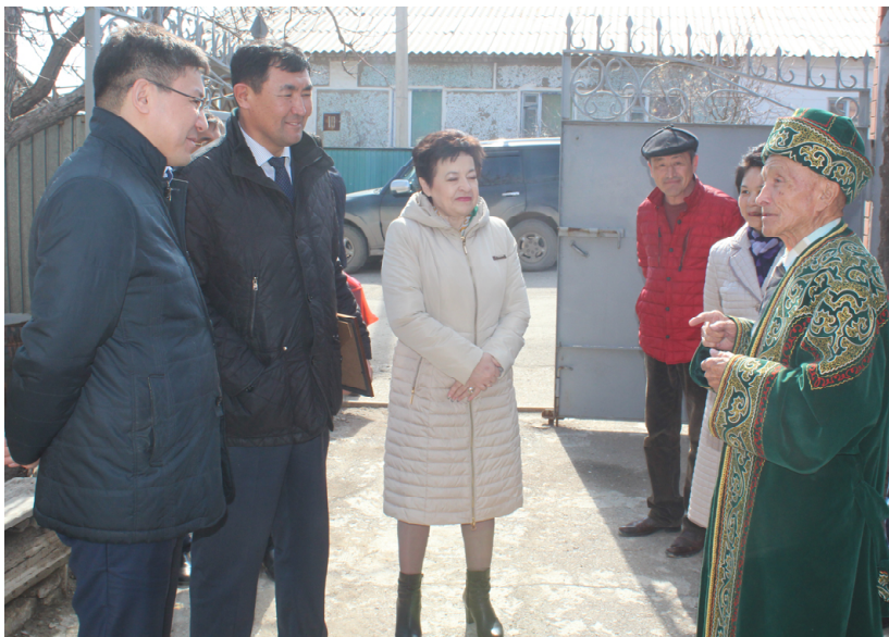
Әңгімесі қандай әсерлі еді!