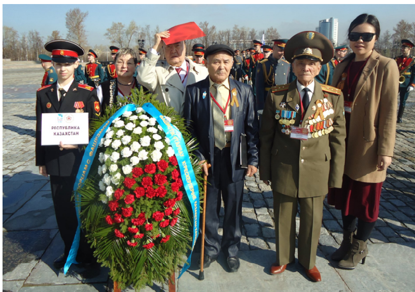
Мәскеуде. 2015 жыл.