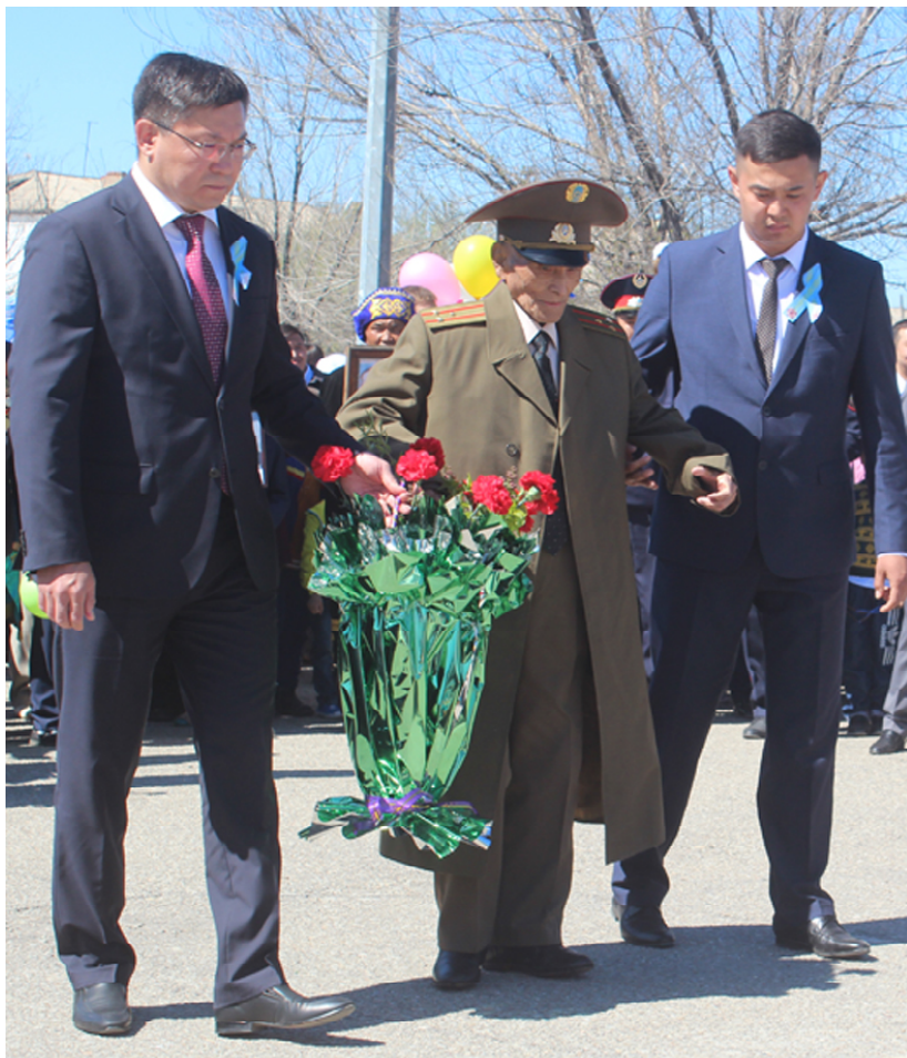
Жеңімпаздар рухына – Мәңгілік тағзым! 9 мамыр, 2018 жыл.