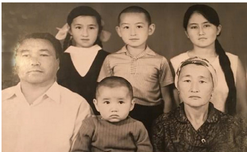
Шаттығы мол «шағын мемлекет»