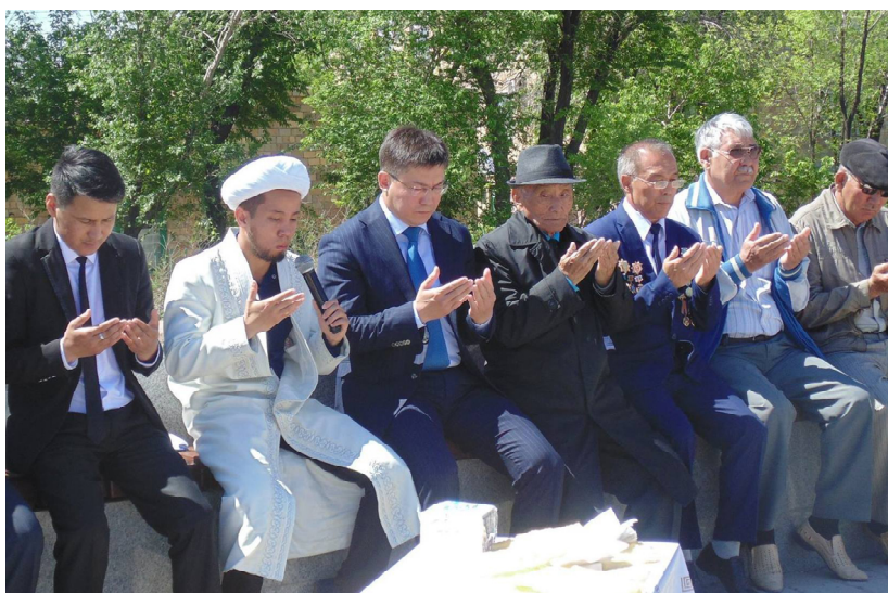
2017 жылғы 31 мамыр. Саяси қуғын-сүргін және ашаршылық құрбандарына дұға бағыштау