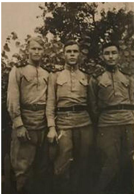
«Жауынгермін, елін жаудан қорғаған!» (оң жақта)