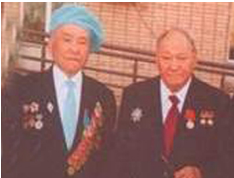
Кеңес Одагының екі дүркін Батыры, аңызға айналған ұшқыш Талгат Бигелдиновпен жүздесудің сәті түсті