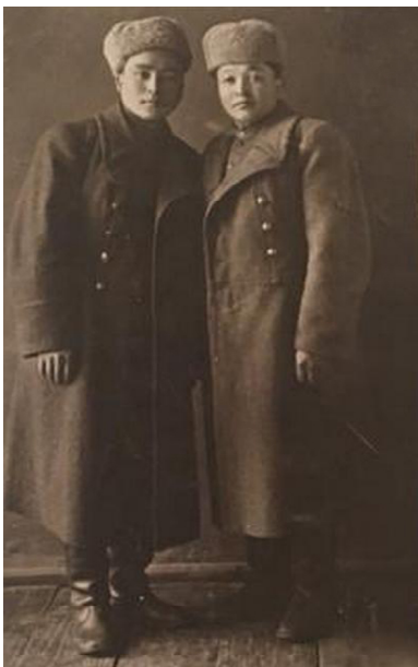
«Офицер боламын» деп жүрген күндер (сол жақта)