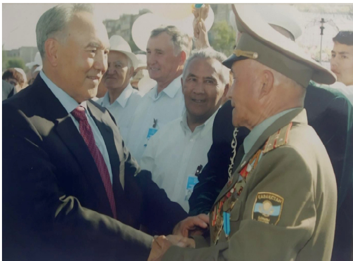
Елбасы Нұрсұлтан Назарбаевпен кездесу