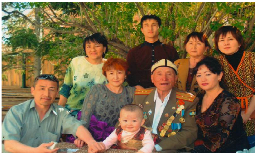
«Адам ұрпағымен мың жасайды»