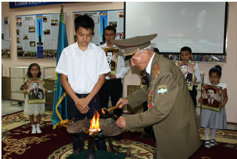
Жезқазған тарихи-археологиялық мұражайында