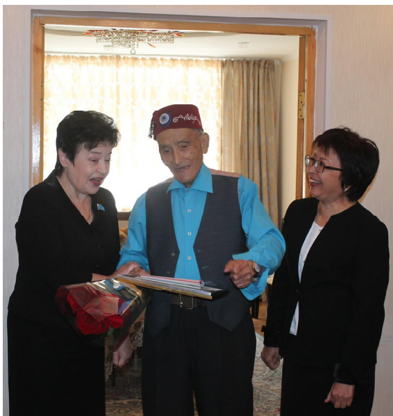
Әзілі қандай әдемі еді!