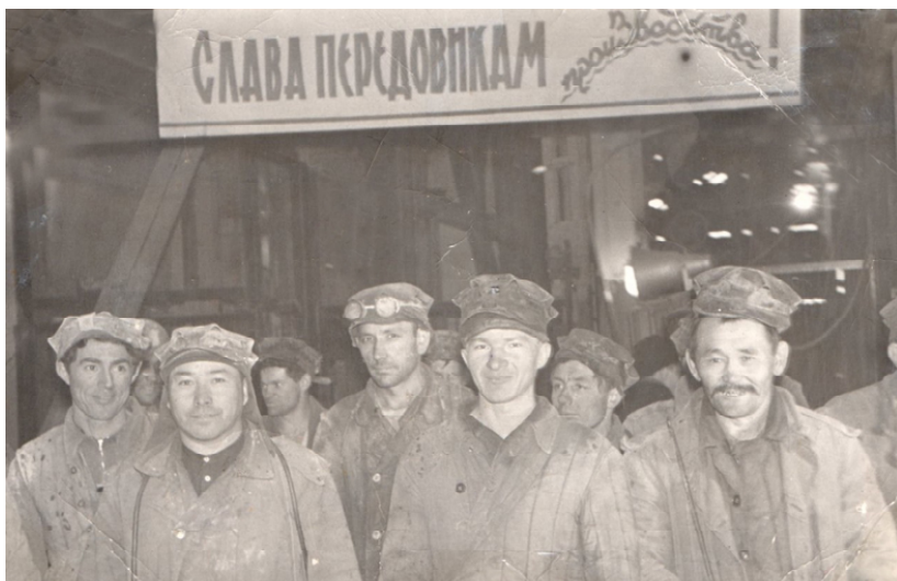
Кеніі болды «Покрода»