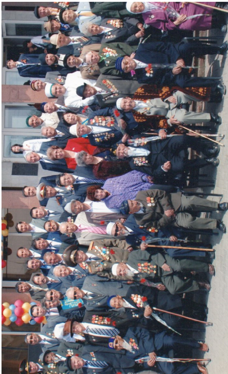
Қара ормандай ардагерлер қайда бүгін?!