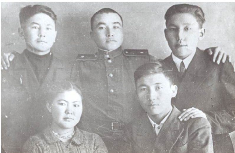
«Бейбіт өмір. Әскери киім шешіле қоймаған кез»